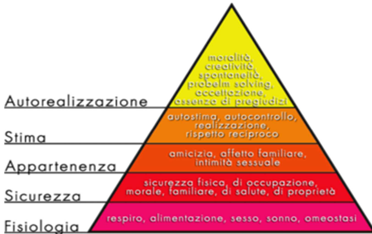
La piramide dei bisogni di Maslow (1954)

Per approfondimenti http://it.wikipedia.org/wiki/Bisogno